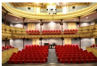
Teatro Bernardim Ribeiro