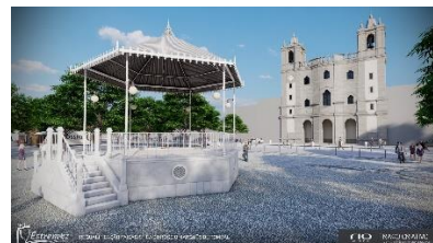
Rossio Marquês de Pombal

Para além do bar, que estará disponível no pavilhão durante o evento, próximo ao recinto, existem diversos estabelecimentos que servem refeições e poderão ser opções para o almoço ou jantar da comitiva.